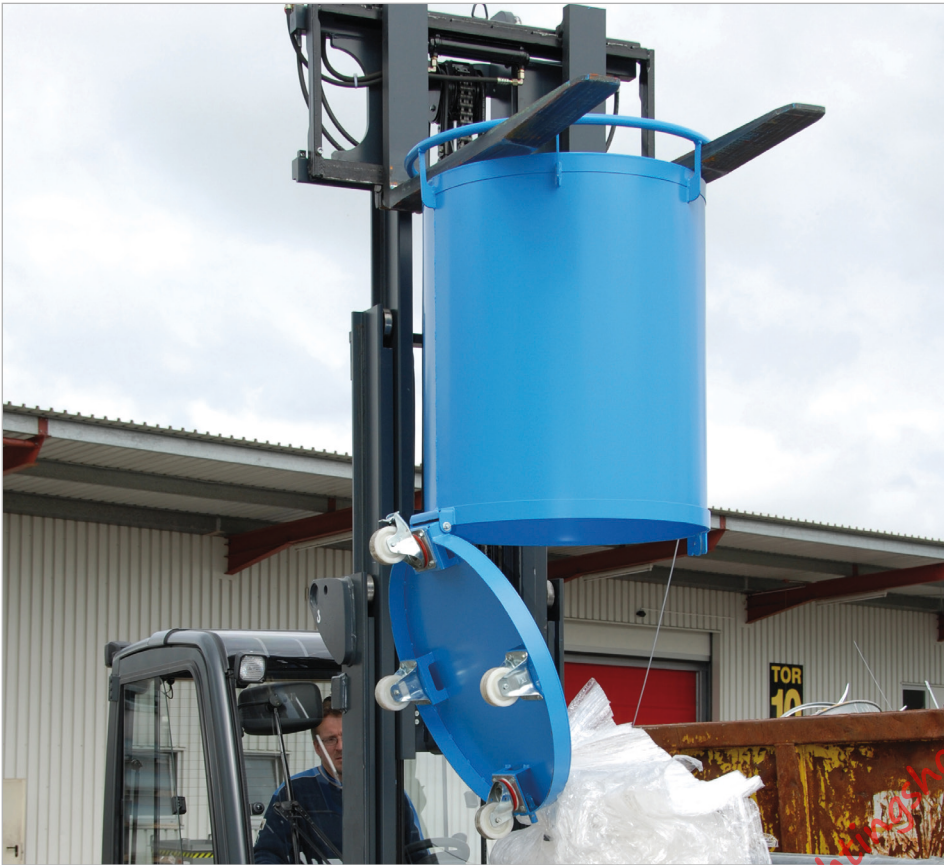
Type RB met wielen