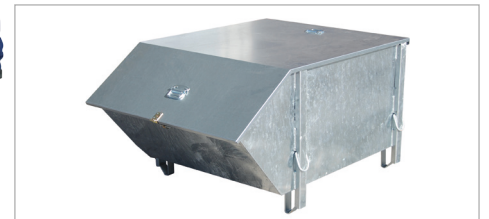
Type BBG met deksel