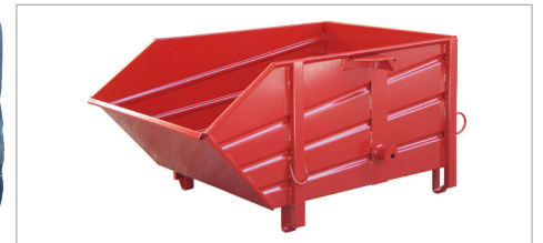
Type BBP met opnamestoppen