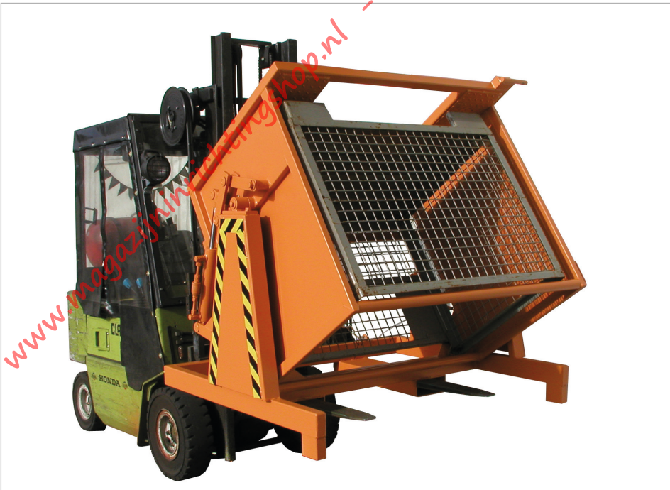
Type KGM met kieprem