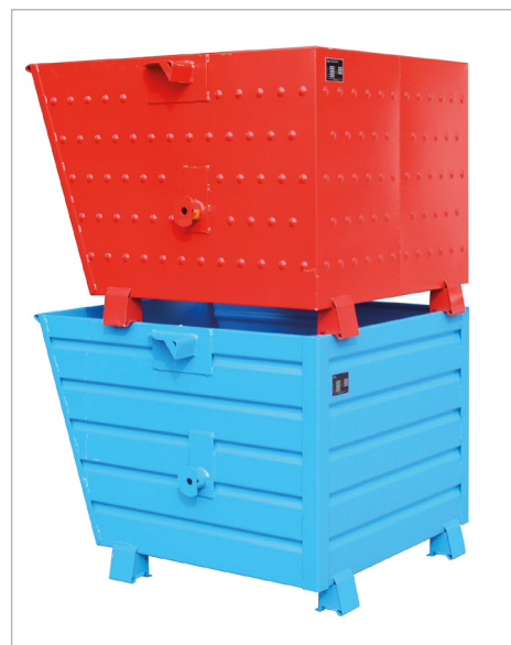
Type BSK-N en type BSK gestapeld