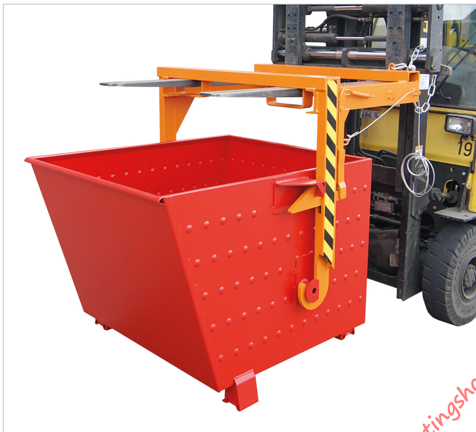
Type BSK-N met traverse type BST