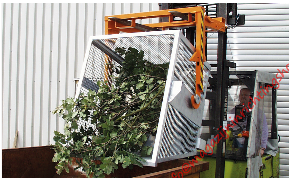
Type BSK-G 90 met Type BST 90