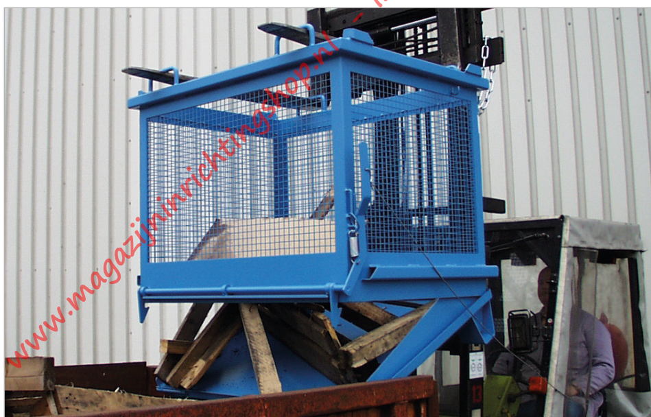
Type SB-G 1000