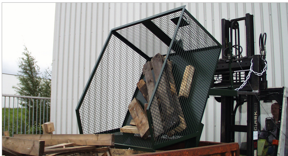
Type GU-G 1000