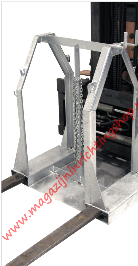
Type SFP 4