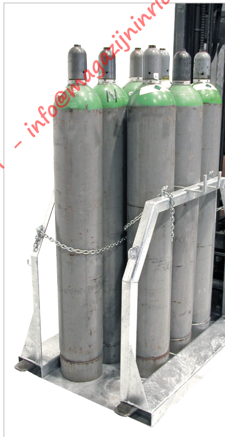
Type SFP 8

Voor het veilige, economische en krachtbesparende transport van 1 tot 8 gasflessen