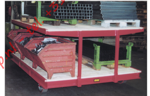
Meerdere laadvloeren d.m.v. opzetbare opbouw