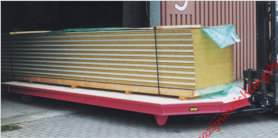
Transport van lange materialen, kleine draaicirkel d.m.v. directopname