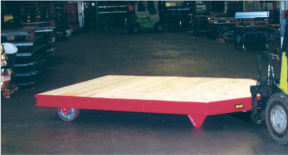
Met de vorken in de inrijdkokers rijden, oppakken en het Heftruck-Tender-Systeem is inzetbaar