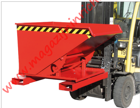
Type 3S, kiefrichting naar links