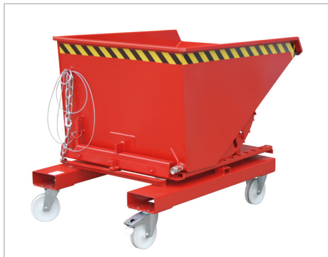
Type S3S (zie pagina 28) met wielen