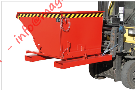
Type 3S, kiefrichting naar rechts