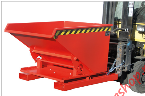
Type 3S, kiefrichting naar voren