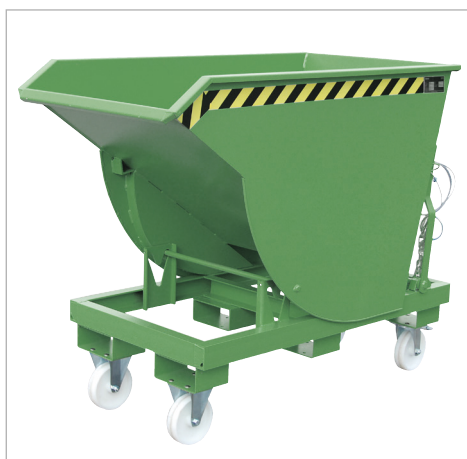
Type BKM met wielen