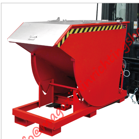
Type BKM met deksel