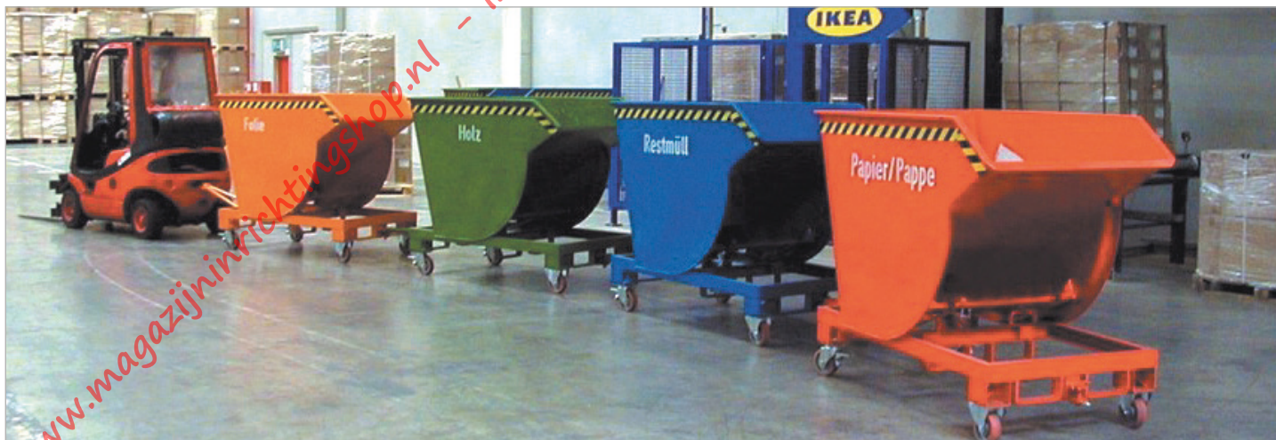
Type BKM met wielen en aanhangerinrichting met dissel