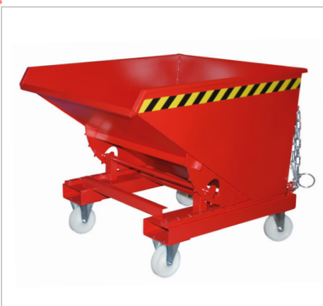
Type EXPO met wielen