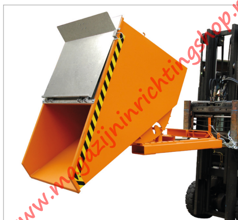
Type EXPO met dekfel