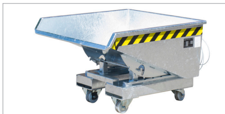
EXPO 225 met wielen