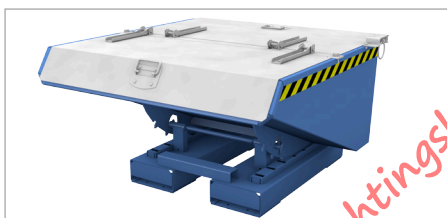
EXPO 225 met deksel