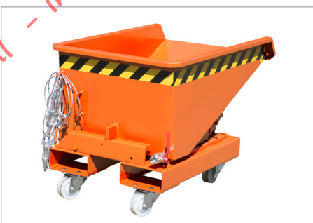
EXPO-E met wielen

Spaandercontainer met lage bouwhoogte en afrolmechanisme