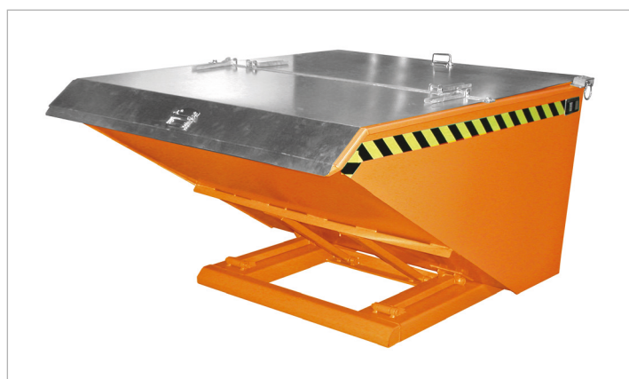
Type NK met deksel