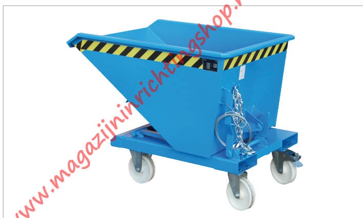
Type NK met wielen