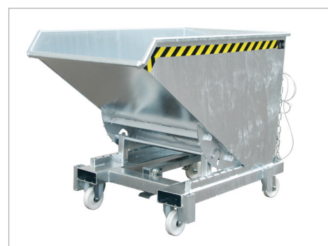
Type SK met wielen