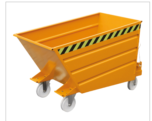
Type VD met wielen