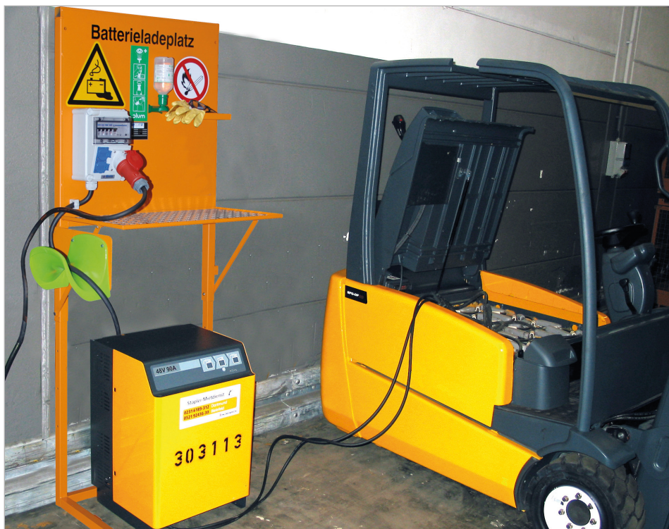
Type BL met CEE krachtstroom-stopcontact 400 V, bij het opladen van een electro-heftruck