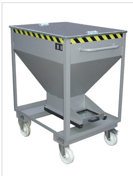
Type SRE-D met deksel