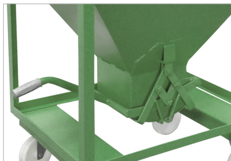
Speciale schaarsluiting met handhendel (SR, SG, SRE)