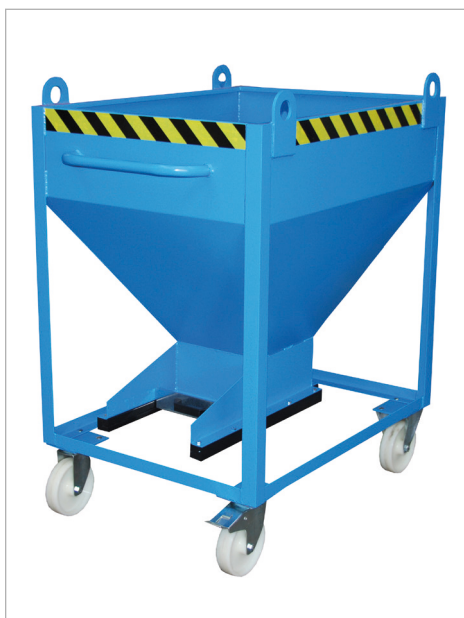
Type SR-D met kraanogen