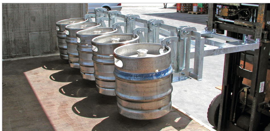
Ook speciale uitvoeringen leverbaar: bijv. voor 30 / 50 liter biervaten