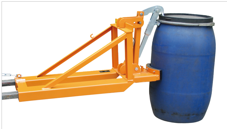
Type RS-I/D 91