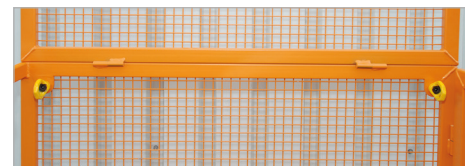
Aanslagpunten voor PSA (persoonlijke beschermuitrusting)