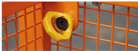
Aanslagpunt voor PSA (Persoonlijke beschermuitrusting)