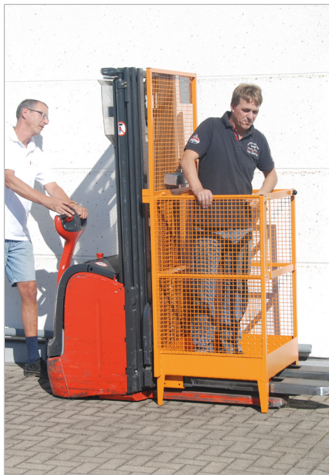
Type MB-I op de disselboomstapelaar