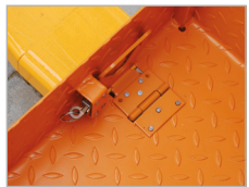
Afglijdbeveiliging voor disselboomstapelaar