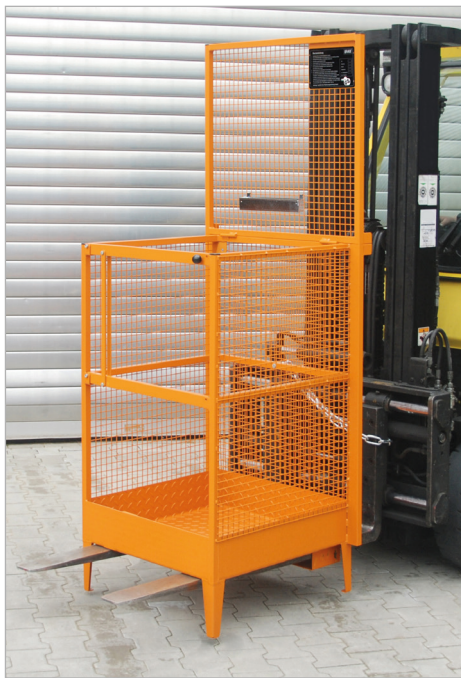
Type MB-I met veiligheidsketting op de heftruck