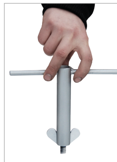
Sleutel voor vleugelmoeren

Voor het aftanken van bouw- en werkmachines, apparaten, aggregaten etc. Internationaal vervoer van gevaarlijke vloeibare stoffen volgens ADR/RID/IMDG-code, verpakkingsgroepen II en III