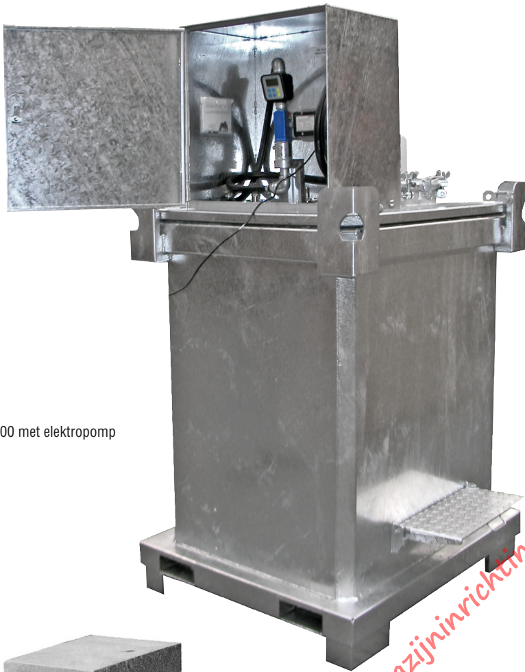
Type DT 1000 met elektropomp