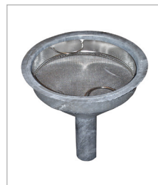
Trechter met zeef van roestvrij staal