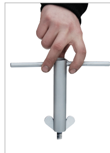
Sleutel voor vleugelmoeren