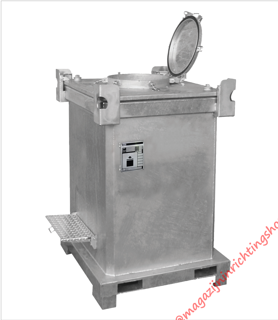
Type DC 1000