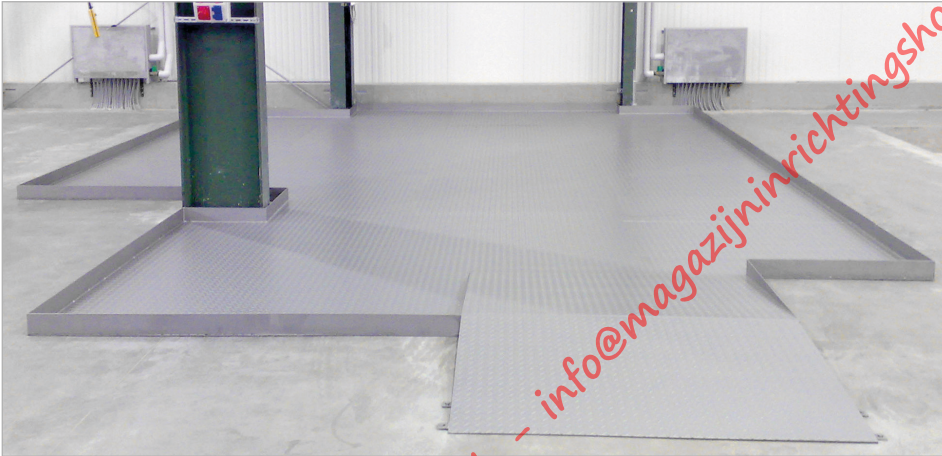
Bodembeschermbekledingen met uitsparing voor pijlers en overrijdplaten