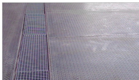
Afloopkanaal met rooster

Volgens duitse richtlijnen "VAwS" en "WHG" moeten transferpunten zoals ook be- en ontladingplaatsen voor water-verontreinigende stoffen een geschikt beveiligingssysteem hebben. De bodembeschermbekledingen voldoen deze voorschriften. Daarbij kunnen mechanische beschadigen van de ondergrond verhinderd worden.