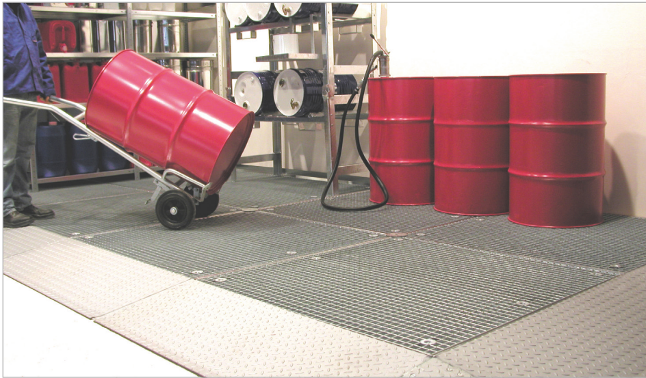
8 x BSW + 5 x AR + 1 x AE + 3 x KV + 10 x WV (opties: vatenkar type FP-V, vatenrekken type FR)