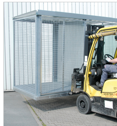
Type GFC-E/G (met scheidingswand)