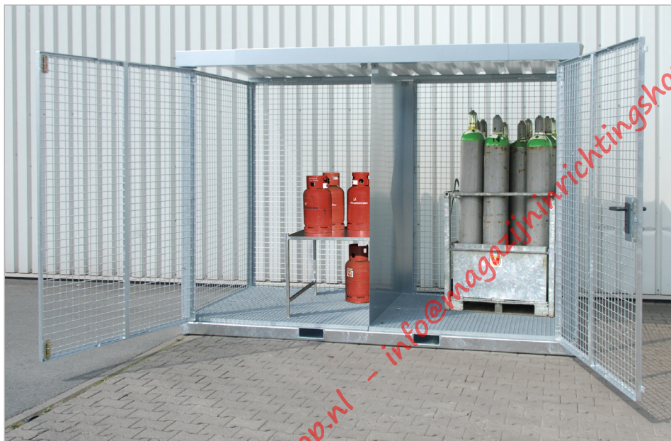
Type GFC-E/G (met scheidingswand)