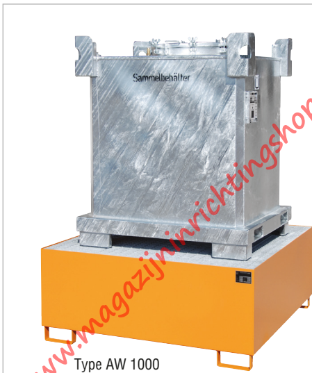
Type AW 1000