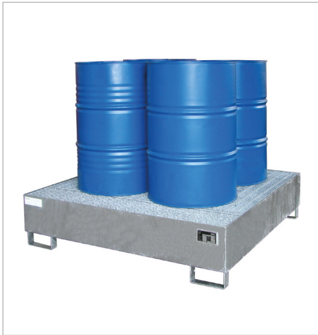
Type AW 450