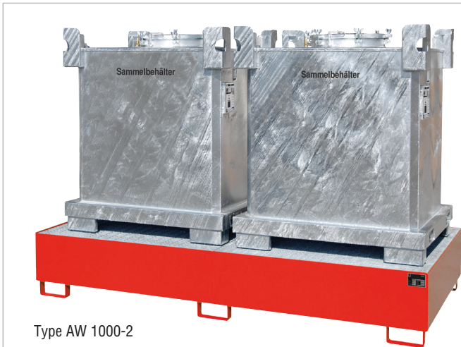
Type AW 1000-2