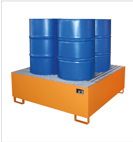
Type AW 800

Opslag van max. 10 vaten à 200 liter of max. 3 containers (IBC) à 1000 liter, ook met 60 liter vaten en kleine blikken combineerbaar