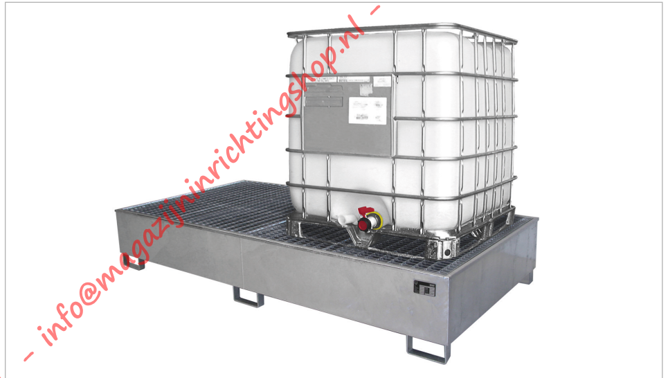
Type AW 1000-2/PE