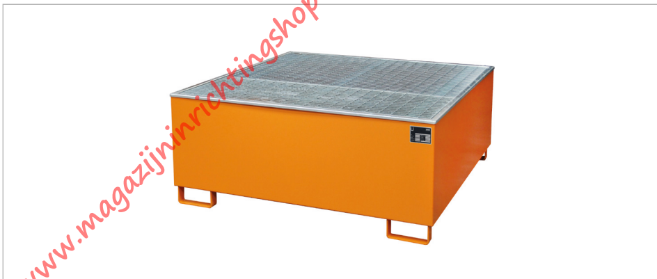
Type AW 1000/PE