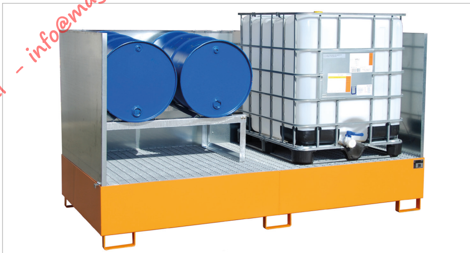
Type AW 1000-2/SW + Type FA 200-2