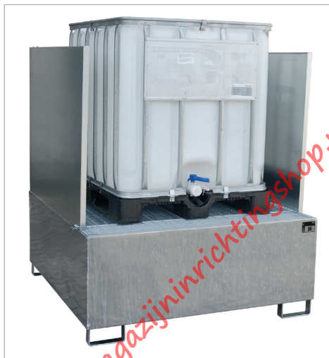
Type AW 1000/SW