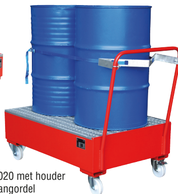
Type 2020 met houder met spangordel