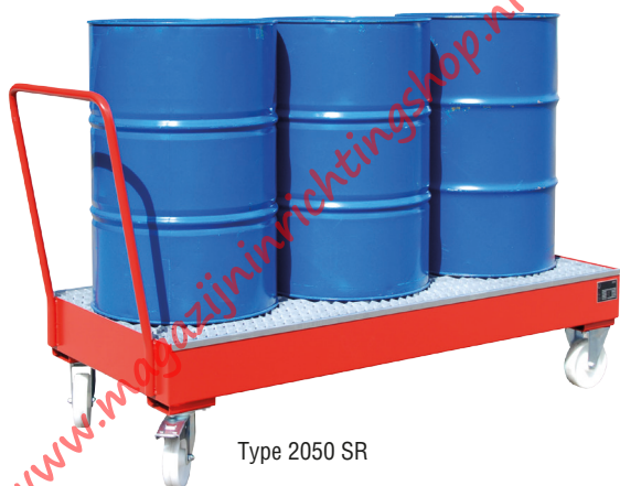
Type 2050 SR