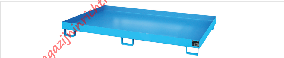
Rekopvangbak type RW-2200-1

Door het inzetten van rekopvangbakken kunnen ook bestaande stellingssystemen economisch snel conform regelgeving worden omgebouwd