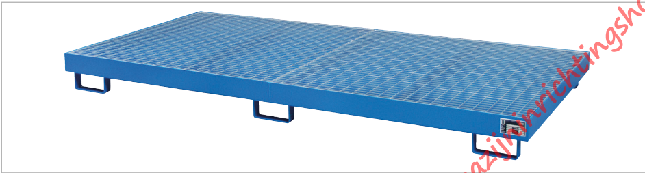
Rekopvangbak Type RW-GR 2700-1