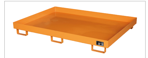
Rekopvangbak type RW 1800