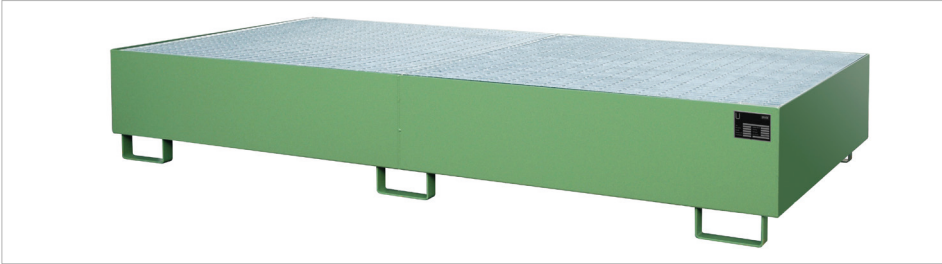
Rekopvangbak Type RW-GR 2700-3