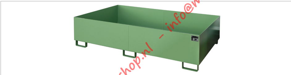
Rekopvangbak type RW 2200-2