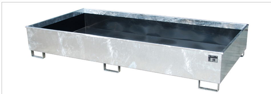
Stellingopvangbak type RW 2700-3 PE

Voor de opslag van agressieve stoffen. Ook bestaande stellingssystemen kunnen snel en eenvoudig conform de wet en regelgeving worden uitgerust met de stellingopvangbakken