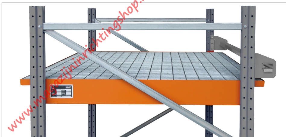
Hangopvangbakken Type EHW 1800