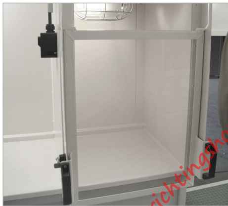
Laboratorium-/analysekast met afzuiging en verlichting