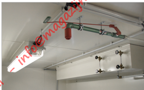
Nooddouche met 250 liter tank en ex-verlichting