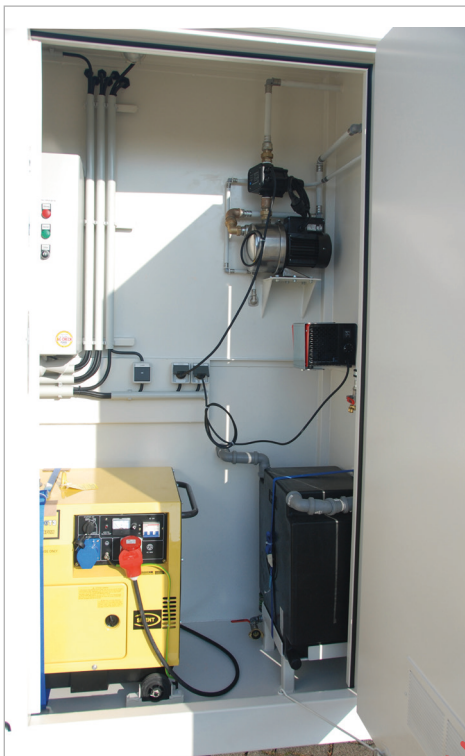
Techniek ruimte met ventilator, schakelkast en noodstroomaggregaat