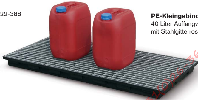
PE-Kleingebindewanne 40 Liter Auffangvolumen mit Stahlgitterrost