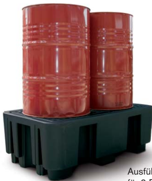
Ausführung 240/2 für 2 Fässer