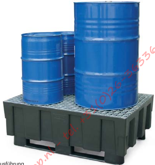
Ausführung mit 2 Kufen und Stahlgitterrost