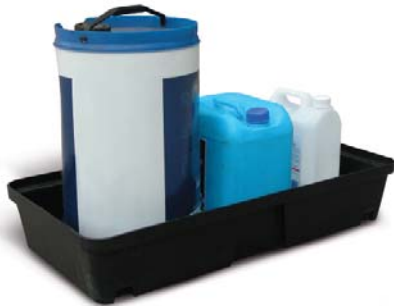
PE-Auffangwanne 30 Liter Auffangvolumen