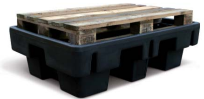
Ausführung 230/2 geeignet für Europaletten