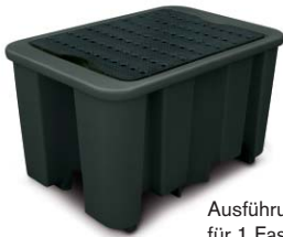
Ausführung 240/1 für 1 Fass