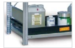
... in Gefahrstoff- und Fassregalen