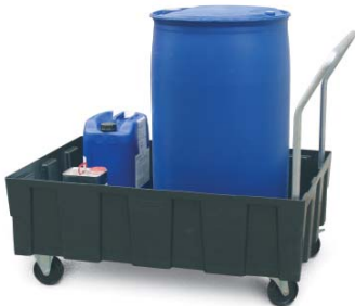
Fahrbare Ausführung, mit Stahlgrundrahmen