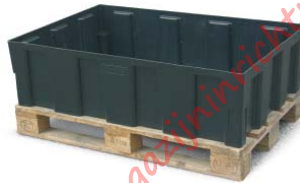
Standardausführung, passend für Europaletten