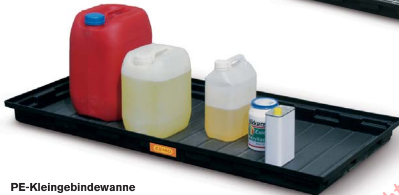
PE-Kleingebindewanne 40 Liter Auffangvolumen