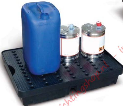
PE-Auffangwanne 40 Liter Auffangvolumen mit PE-Rost