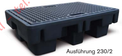
Ausführung 230/2 für 2 Fässer