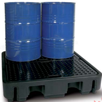
Ausführung 240/4 für 4 Fässer