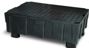
Ausführung mit 4 Füßen und PE-Rost