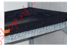
Zum Einsatz in Umweltschrank oder ...