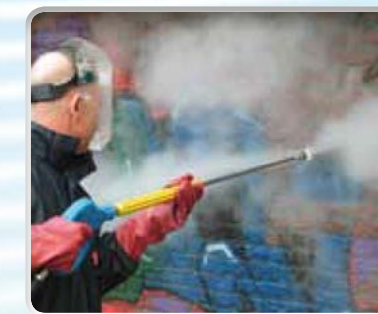
Graffiti verwijderen: zonder reinigings-/afbijtmiddelen