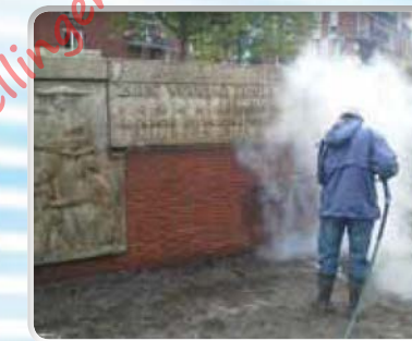
Gevelreinen: zonder chemie en zonder beschadigen