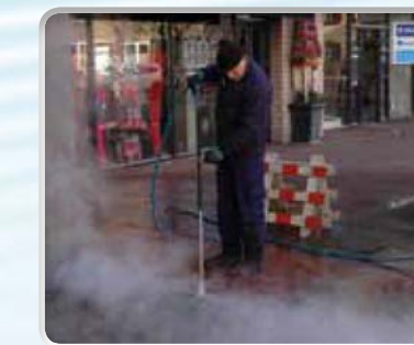
Kauwgum verwijderen: 4 tot 5 keer sneller