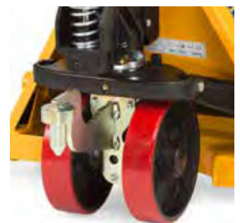
22291 Verbinding hefwagen

Stabiele koppelingspin \varnothing 25 mm met geleidingsmond en zelfstandige veiligheidsvergrendeling aan de zwenkwielzijde. Koppelingshoogte 200 mm.