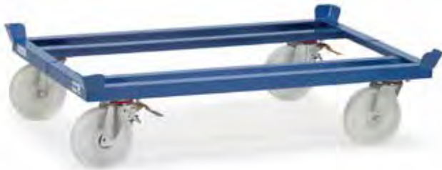
23881 | 23882