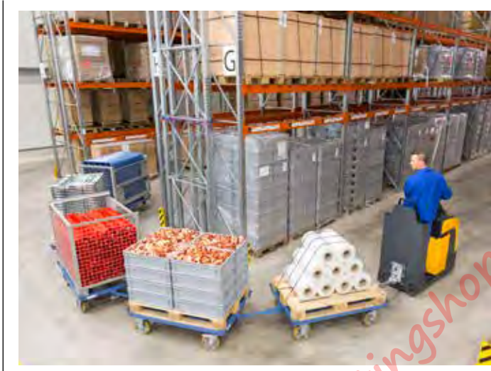
Eenvoudig te manoeuvreren