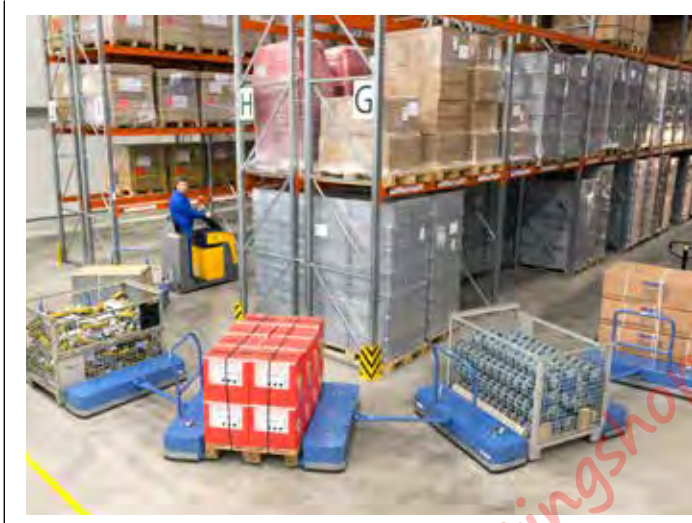
Eenvoudig te manoeuvreren