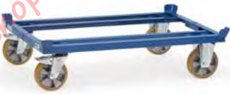
22699 | 22700 | 22701 | 22702

* Alle speciale uitvoeringen op pagina 96/97 zijn niet geschikt voor de lichte palletonderwagen 22501.