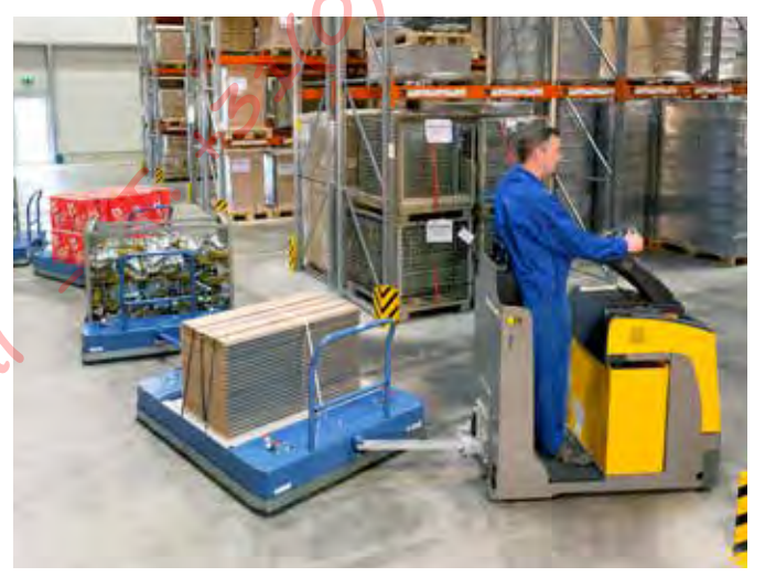
Zeer hoge spoortrouwheid