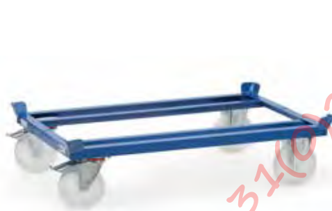
22879 | 22880 | 22881 | 22882