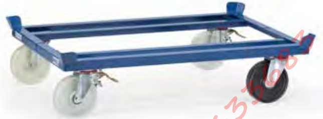
23891 | 23892