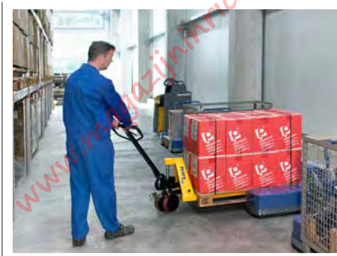
(Ont)laden d.m.v. handpallettruck