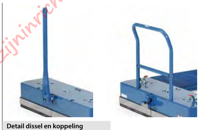
Detail dissel en koppeling

Zelfborgende dissel van platstaal aan de bokwielzijde. Disselooog \varnothing 26,5 mm. Bekwame voetbediening. Gaat zelf omhoog d.m.v. gasdrukveer.