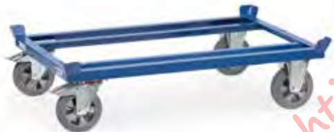
22809 | 22810 | 22811 | 22812