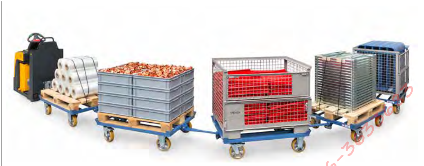
Elektro routetrein met trekker en 5 palletonderwagens