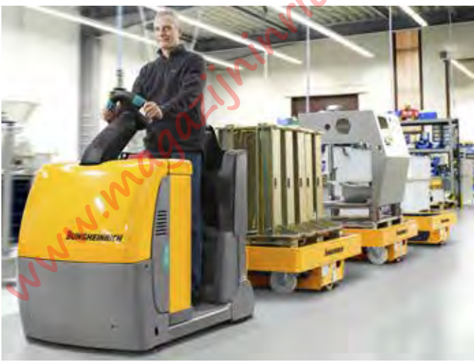
Toepassing in de praktijk