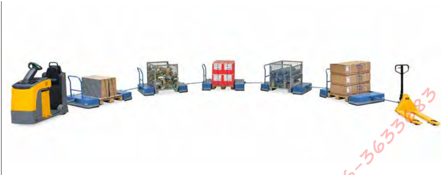
Routetrein met elektro trekker en 5 lage vloer palletonderwagens