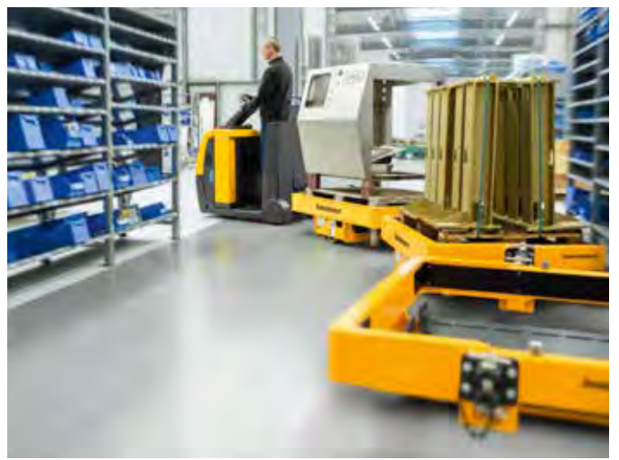
Toepassing in de praktijk