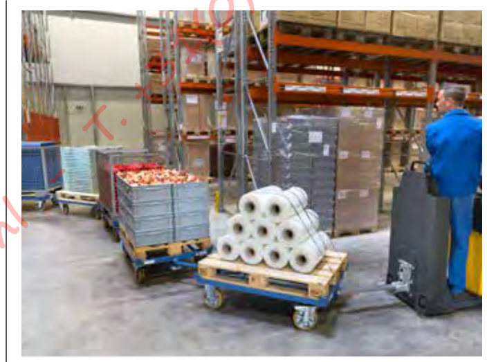
Zeer hoge spoortrouwheid