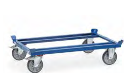
22799 | 22800 | 22801 | 22802

Versterkte zwaarlast uitvoering, polyurethaan wielen 200 x 50 mm, naaf met kogellager. Zeer geringe rolweerstand, elastische loop en geruisloze loop.