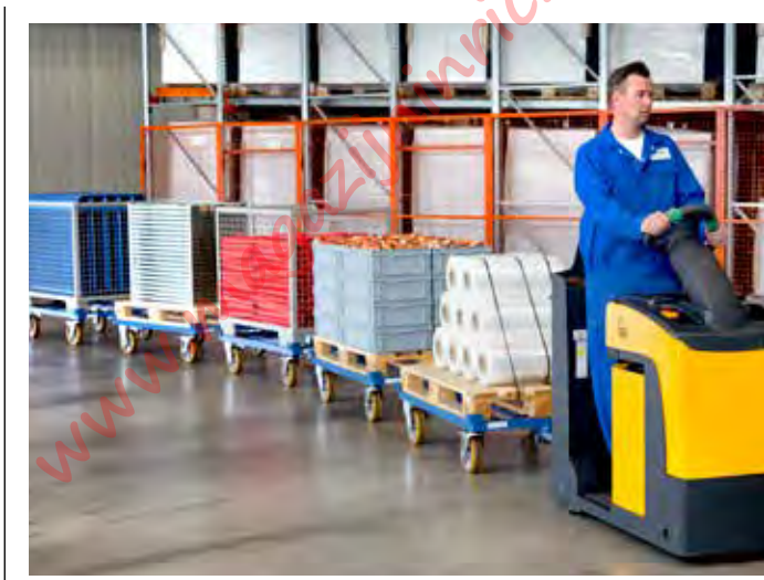
Veilige en spoorstabele loop