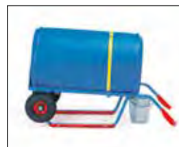
Steekwagen ingebruik bij aftappen.