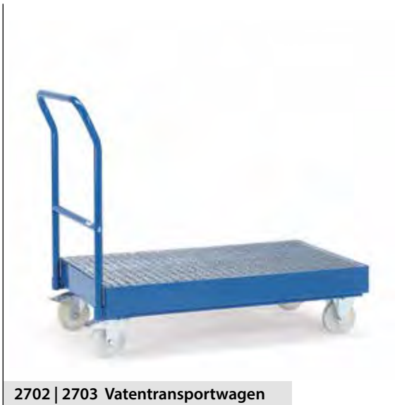
2702 | 2703 Vatentransportwagen