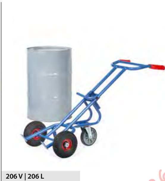
206 V | 206 L