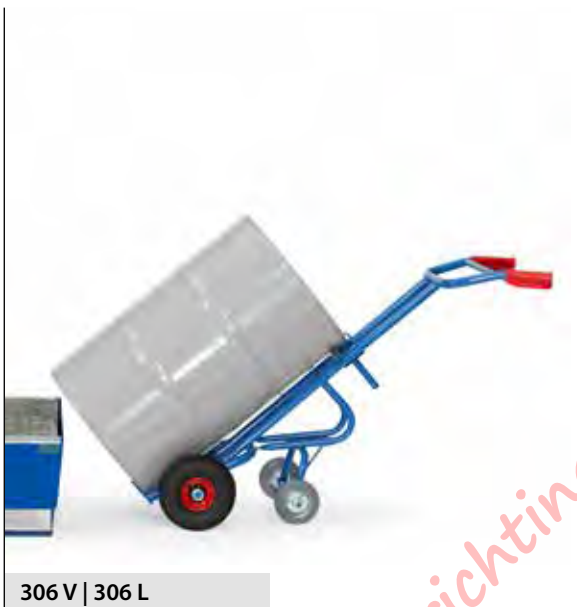
306 V | 306 L

Als 106, echter met een steunwiel van TPE rubber 200 x 40 mm.