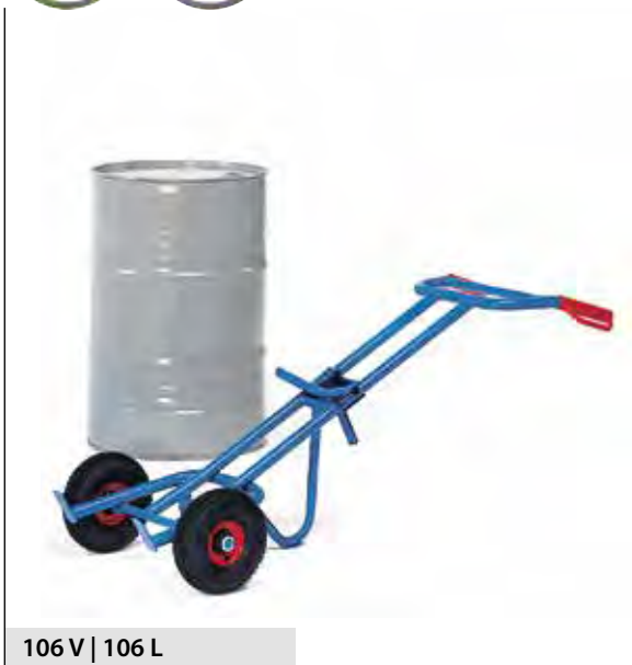
106 V | 106 L