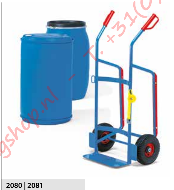
2080 | 2081