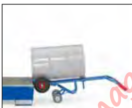
Afzetten van een vat op een opvangbak.